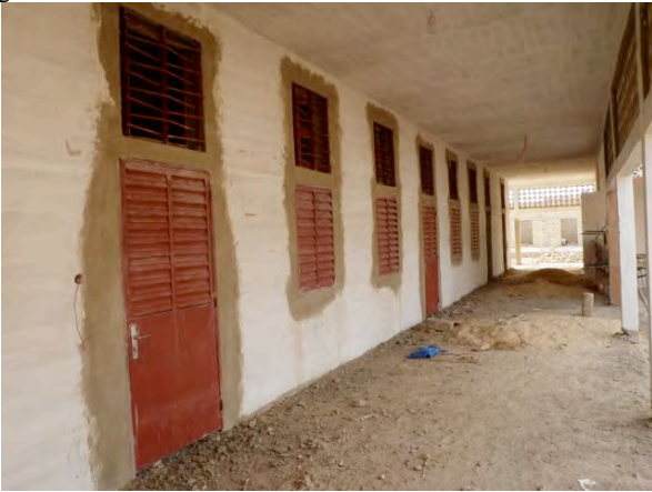
Galerie Module 4 - avril 2010

La construction du module de la bibliothèque est en phase d'achèvement pour une livraison avant l'hivernage et les pluies torrentielles. Il ne reste plus que les finitions de carrelage, de peinture, la pose des vitres et des appareillages électriques. Cette phase est toujours la plus délicate sur les chantiers, et encore plus au Sénégal.