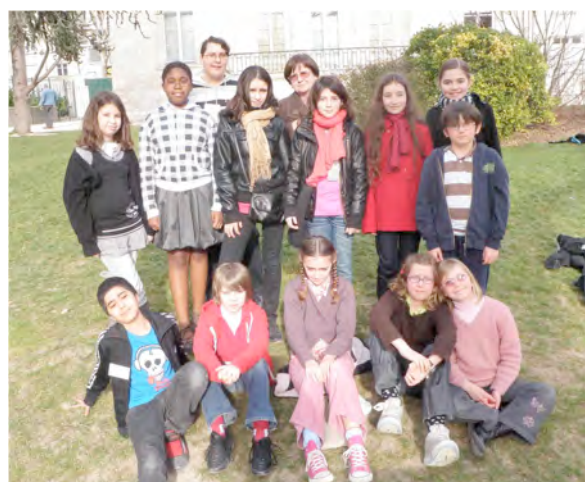
La commission Solidarité Internationale