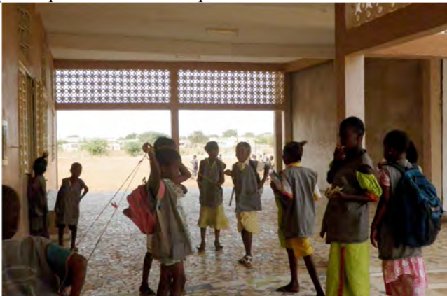
préau entre les bâtiments 2 et 4

La réalisation de ce module marque une étape importante dans la construction de l'école car elle permet, enfin, de clore le premier patio, et de voir à quoi ressembleront les espaces de l'école une fois terminée. On peut maintenant bien apprécier les qualités spatiales de fraîcheur et d'ombrage des larges galeries périphériques, l'échelle humaine et conviviale des espaces intérieurs, sans oublier les plantations du patio qui commencent à pousser !