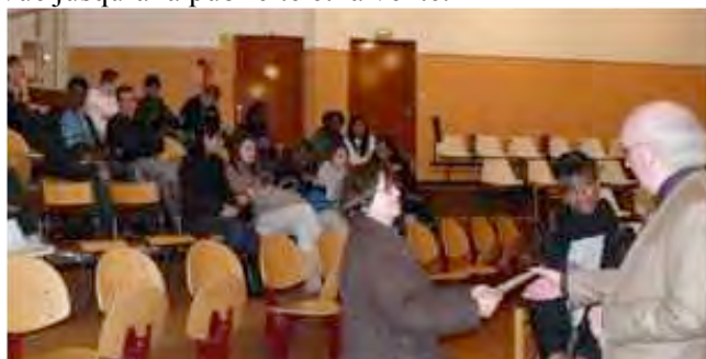
séance solennelle pour la remise du chèque

Cette somme est le bénéfice de la vente de photos de classe, que les jeunes ont organisée, depuis la prise de vue jusqu'à la publicité et la vente.