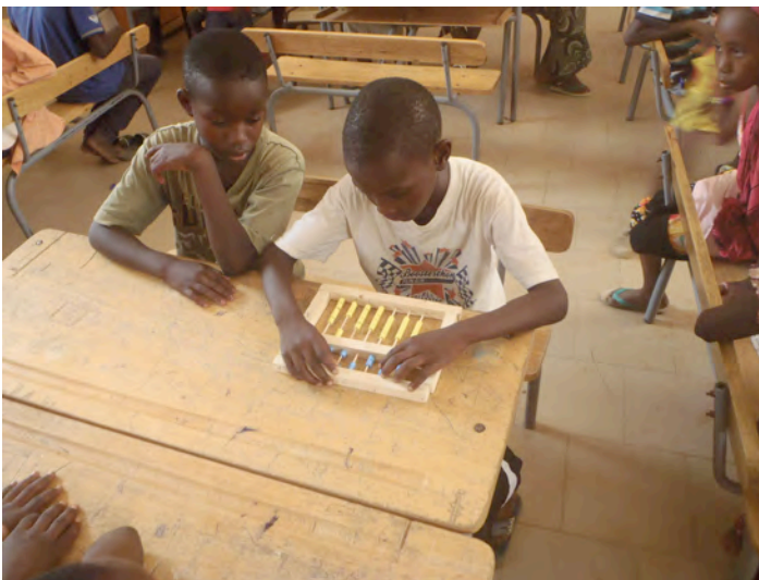
A Dagana, utilisation du boulrier