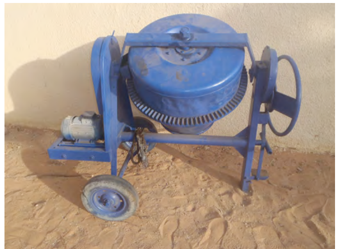
La bétonnière est enfin arrivée à Dagana !

Par ailleurs, dans le cadre des décisions prises en 2013 avec l'association Xarito pour améliorer la méthodologie de travail sur place, nous avons réussi, après beaucoup de péripéties, à faire parvenir une bétonnière opérationnelle à Dagana... Il est temps que les travaux redémarrent !