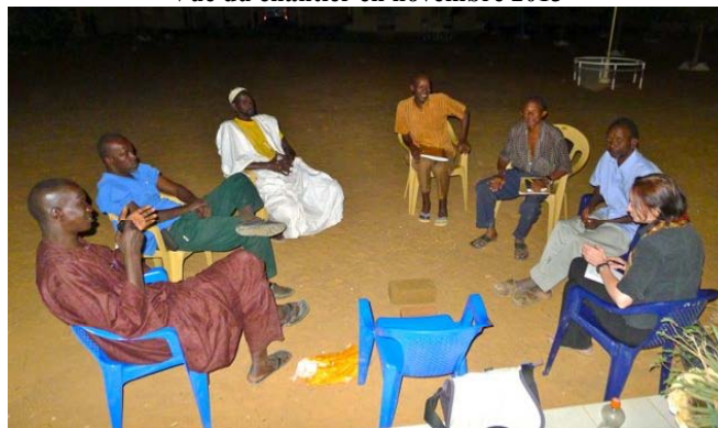
Réunion finale avec l'ensemble des partenaires