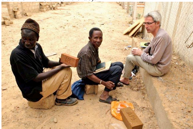
Présentation de la BTC à Dagana

Ces briques BTC ont été montrées à Xarito et à l'équipe technique, et ont reçu un accueil enthousiaste, rappelant les anciennes techniques du banco local (construction traditionnelle en terre crue).