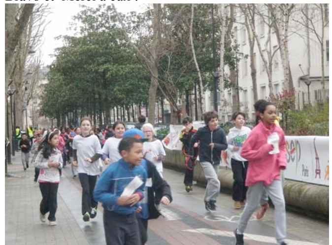
Les enfants à fond !