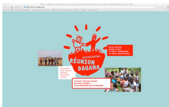
Page d'accueil du site

N'hésitez pas à le consulter et à nous donner votre avis. Vous y trouverez l'histoire de l'association, nos projets et notre actualité. Vous pouvez aussi acheter en ligne les livrets et le DVD des correspondances filmées.