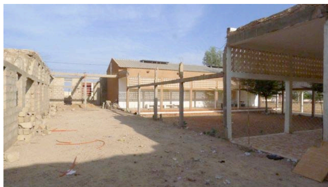
Vue du chantier en novembre 2013

Les architectes ont fait l'inventaire des ouvrages à conserver ou à démolir, et adapté les plans en conséquence. Ces démarches communes se sont déroulées dans une excellente ambiance, avec une réelle envie partagée de mieux faire pour la suite.